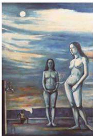
左 藝術家謝宛儀《Nude in the Dusk》、油畫、193×130 cm、1975。